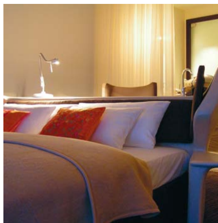
Grote foto vorige pagina: East Hotel Grote foto boven: Side Hotel Links: Berliner Boven: Kamer in het East Hotel